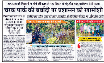
15 अक्टूबर को प्रकाशित समाचार