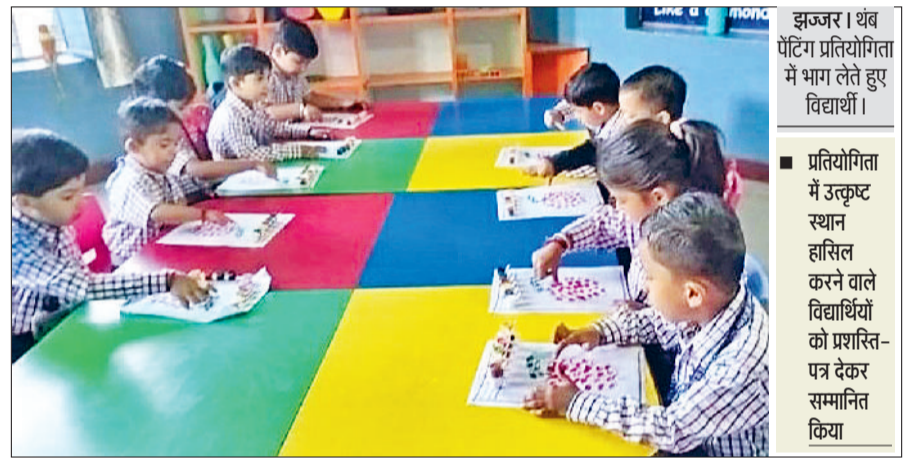
झज्जर। थंब पेंटिंग प्रतियोगिता में भाग लेते हुए विद्यार्थी।

बच्चों की प्रस्तुतियों की सराहना की बच्चों की प्रस्तुतियों की सराहना करते हुए कहा कि बच्चों में इसी तरह का उत्साह और लगन बनी रहनी चाहिए। निरंतर अभ्यास और आत्मविश्वास से ही वे अपने जीवन में नई ऊंचाइयों को प्राप्त कर सकते हैं। कार्यक्रम के दौरान स्केचिंग, पोस्टर मेकिंग, भाषण, थाली, कलश सजावट, रंगोली, प्रश्नोत्तरी, एकल नृत्य, समूह नृत्य, देशभक्ति समूह गीत और एकल गीत जैसी प्रतियोगिताओं में विद्यार्थियों ने प्रतिभा दिखाई।