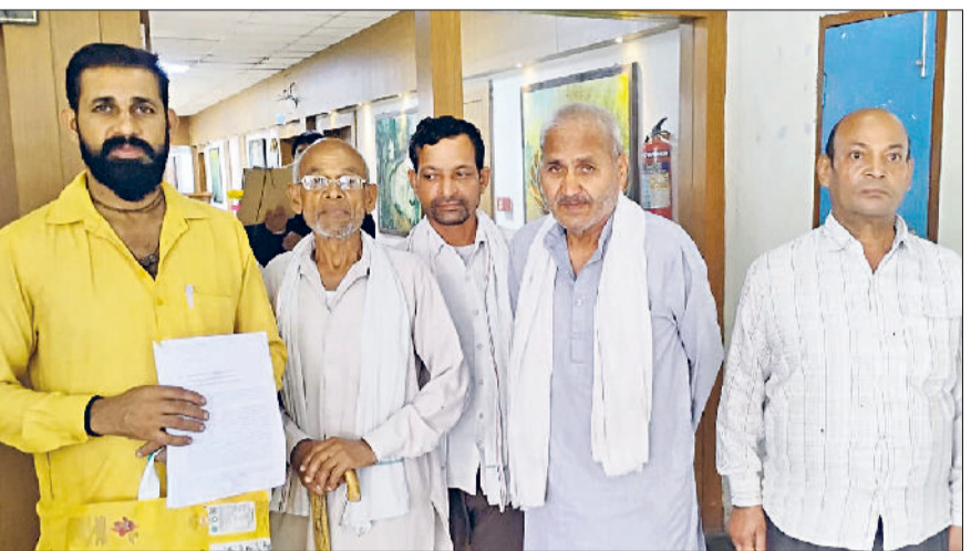
बहादुरगढ़। डीसी को शिकायत देकर आते फुटकर सब्जी विक्रेता।