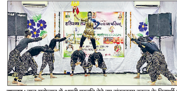
झज्जर। बाल महोत्सव में अपनी प्रस्तुति देते हुए संस्कारम स्कूल के विद्यार्थी।

हासिल किया। संस्कारम स्कूल के विद्यार्थियों ने शिक्षा, कला और संस्कृति की हर श्रेणी में अपनी श्रेष्ठता साबित की।