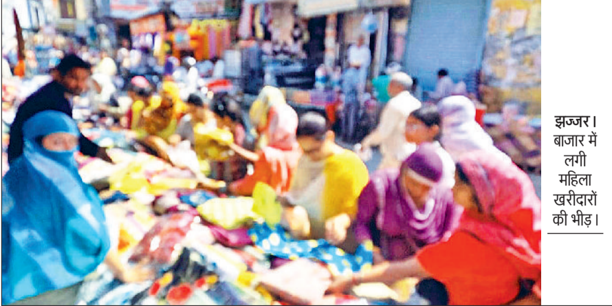
झज्जर। बाजार में लगी महिला खरीदारों की भीड़।

दीपावली पर्व के चलते शहर के बाजार पूरी तरह सजकर तैयार हैं। जगह-जगह रंग-बिरंगी लाइटों, सजावटी लड्डियों, दीयों, मोमबत्तियों और सजावटी वस्तुओं की चमक ने माहौल को पूरी तरह उत्सवमय बना दिया है। दुकानदारों ने ग्राहकों को लुभाने के लिए अपनी दुकानों को आकर्षक तरीके से सजा लिया है। शहर के पुराना बस स्टैंड मार्ग,