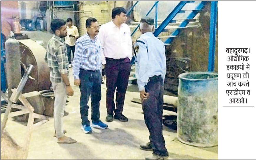
बहादुरगढ़। औद्योगिक इकाइयों में प्रदूषण की जांच करते एसडीएम व आरओ।

एसडीएम और आरओ रात में भी कर रहे औद्योगिक क्षेत्रों में जांच, कड़े निर्देश दिए