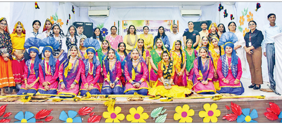
झज्जर। होनहार प्रतिभागी आयोजक समिति और मुख्यातिथि के साथ।