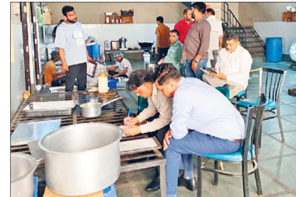
बहादुरगढ़। एक मिष्ठान भंडार पर जांच करने पहुंची टीम।

त्योहारी सीजन में सीएम फ्लाइंग व खाद्य सुरक्षा विभाग की ओर से मिठाइयों की दुकानों पर छापेमारी की जा रही है। इसी कड़ी में वीरवार को संयुक्त टीम ने बहादुरगढ़ इलाके में तीन दुकानों पर दबिश देकर मिठाइयों का निरीक्षण किया। टीम ने शहर में सब्जी मंडी के पास भगवान स्वीट्स से रसगुल्ले व बर्फी, बादली चुंगी स्थित भीम जी बिकानेर से गुलाब जामुन व बर्फी के सैपल लिए। इसी तरह नूना माजरा स्थित जयभगवान मिष्ठान भंडार से पत्तीसा व बर्फी के सैपल लिए। जांच के दौरान तीनों दुकानों