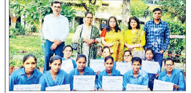
झज्जर। स्कूल स्टॉफ सदस्यों के साथ प्रतियोगिता के विजेता विद्यार्थी।